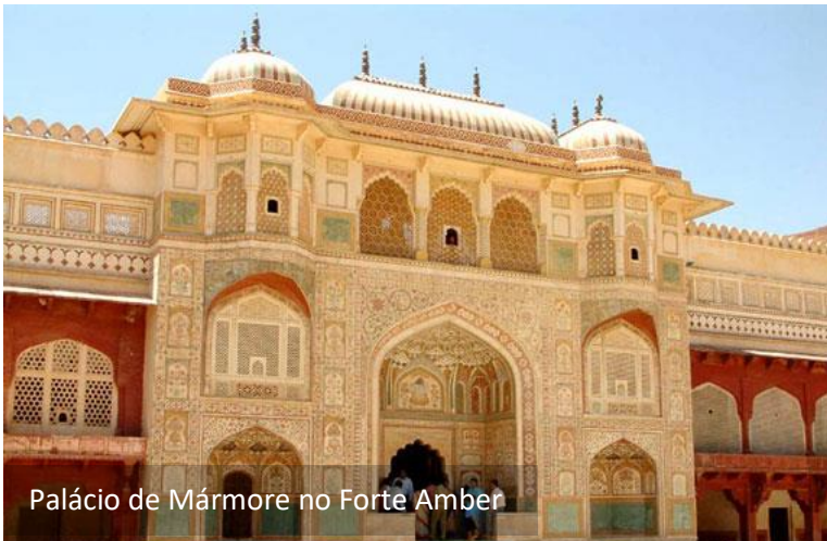
Palácio de Mármore no Forte Amber