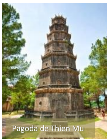
Pagoda de Thien Mu