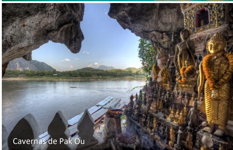
Cavernas de Pak Ou