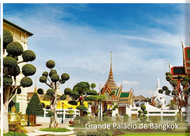
Grande Palácio de Bangkok