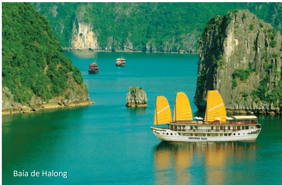
Baía de Halong