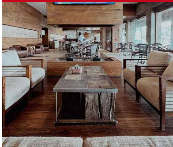
Radisson Puerto Varas