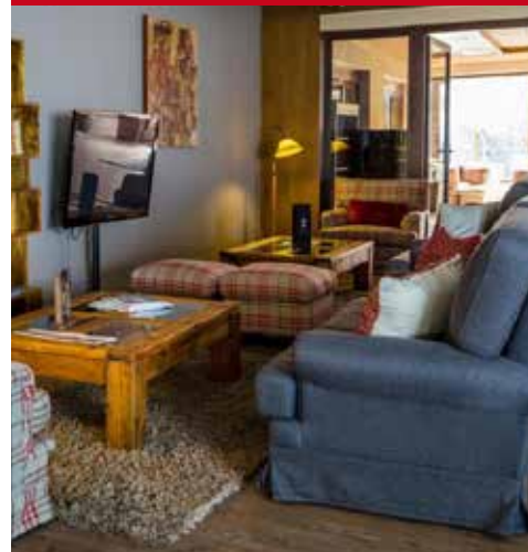
Puralã - Wool Valley