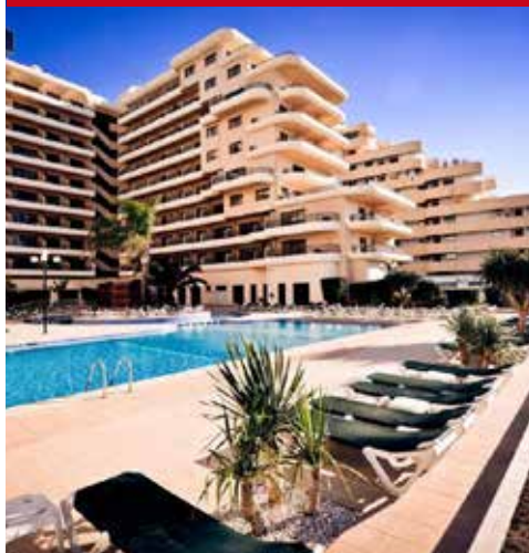
Vila Galé Marina