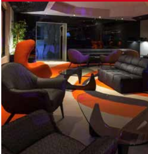
Fénix Porto ou Ipanema