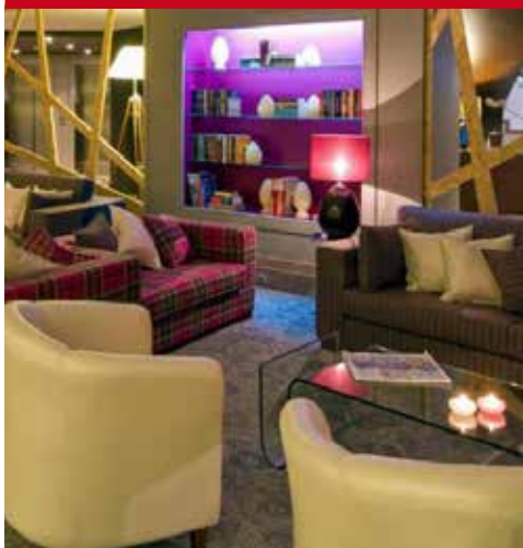
Estrela de Fátima