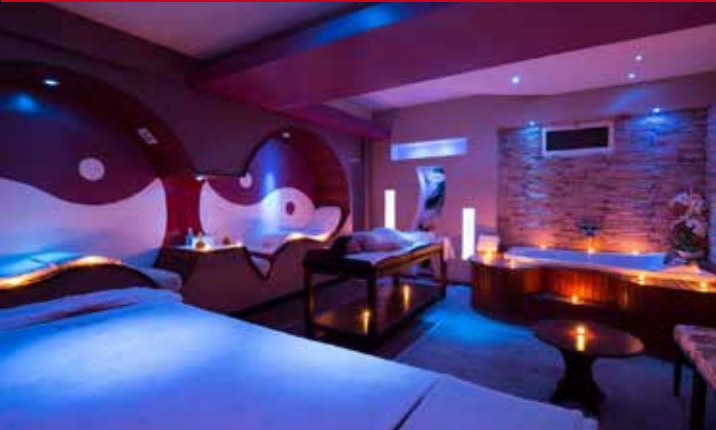
Hotel Lycus River