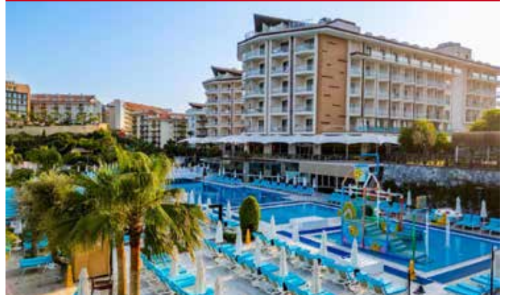
Hotel Ramada Resort