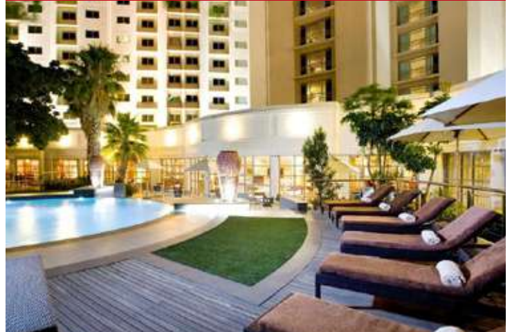
Southern Sun Waterfront