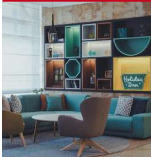
Holiday Inn Skopje