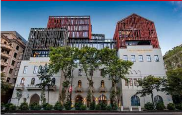
Philharmonic by Mercure