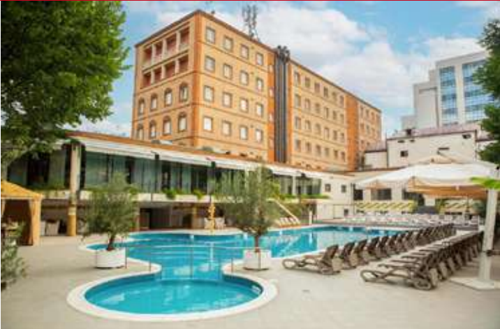
Best Western Congress

Viajar para Armênia, Geórgia e Azerbaijão em outubro é uma excelente escolha — é uma das melhores épocas do ano para explorar o Cáucaso.