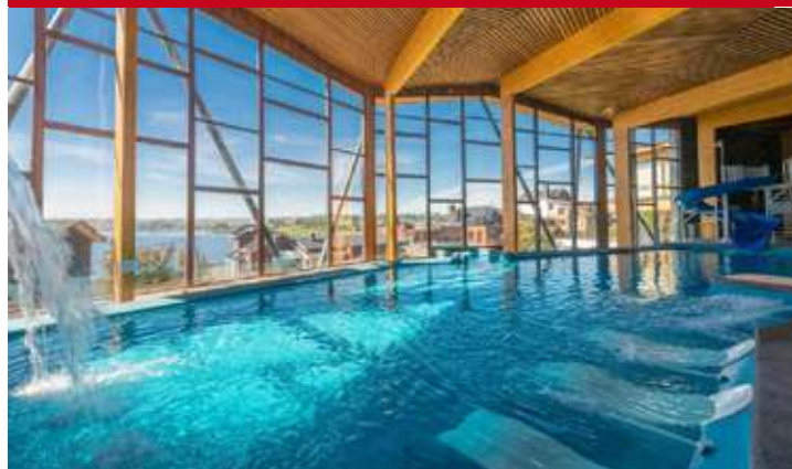
Cabañas del Lago