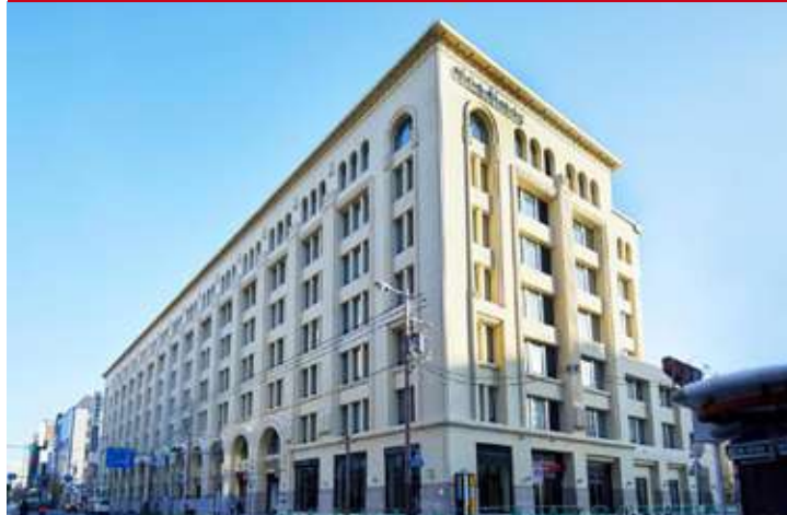
Citatines Namba Osaka