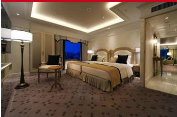
Nikko Princess Kyoto