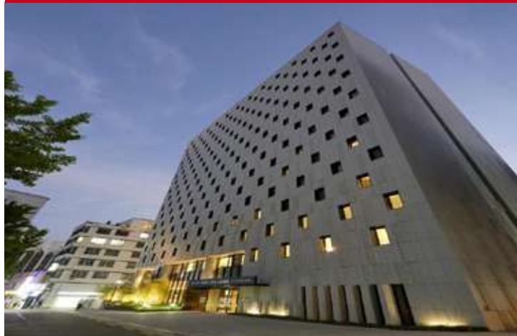
Sotetsu Splaisir Myeongdong