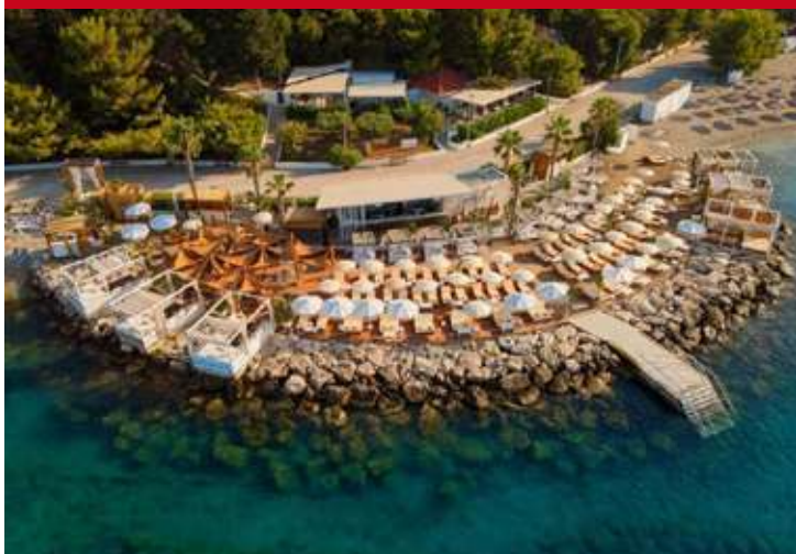
Radisson Blu Resort