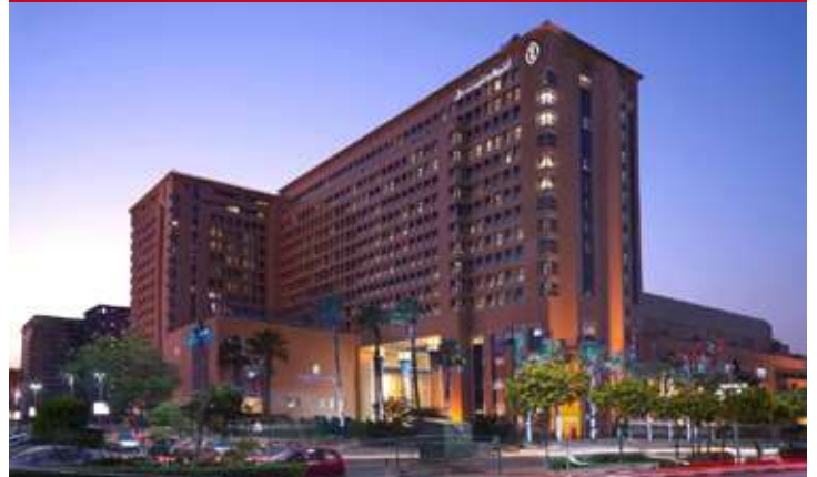
Intercontinental City Stars