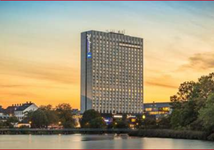
Radisson Blu Scandinavia