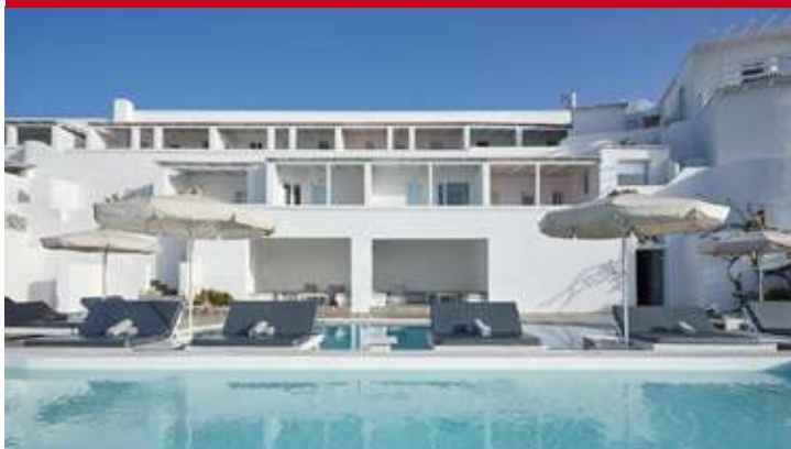
Notos Therme & Spa