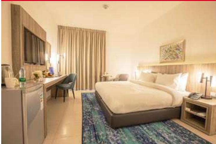
Golden Tulip Amman