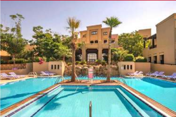
Holiday Inn Resort Dead Sea