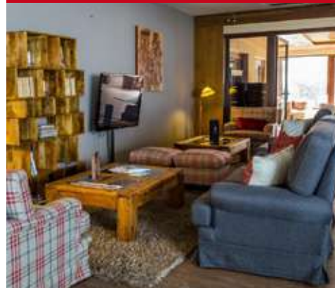
Puralã - Wool Valley