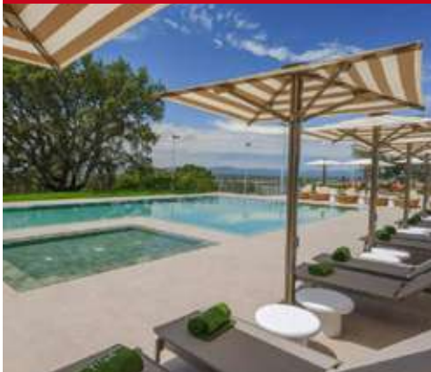
Meliá Castelo Branco