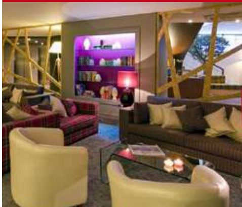
Estrela de Fátima