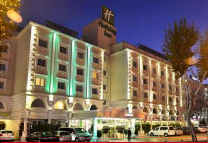
Holiday Inn Istanbul City