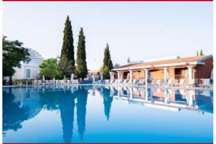
Colossae Thermal & Spa