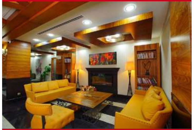
New Park Ankara