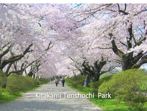
Kitakami Tenshochi Park