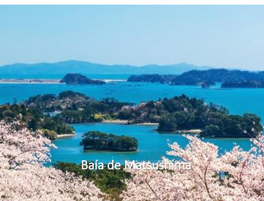
Baía de Matsushima