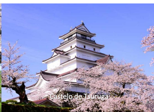
Castelo de Tsuruga