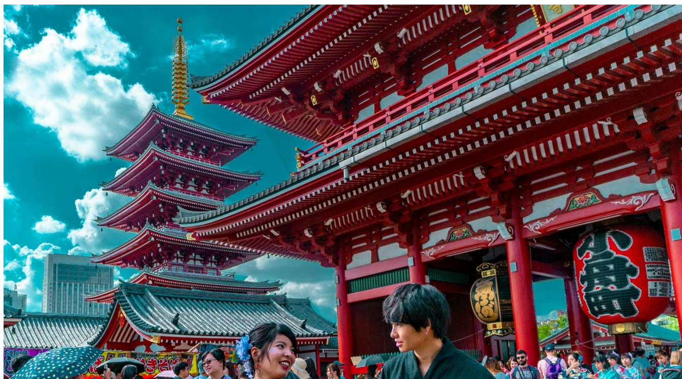
Templo Sensoji em Asakusa – Tóquio, Japão.

Em seguida, passagem pela região de Ueno, incluindo o Santuário Toshogu e o Lago Shinobazu. O roteiro segue para o Santuário Meiji, cercado por uma agradável área verde, e termina no famoso cruzamento de Shibuya, com parada para fotos na estátua de Hachiko. Ao final do dia, retorno ao hotel. Hospedagem.