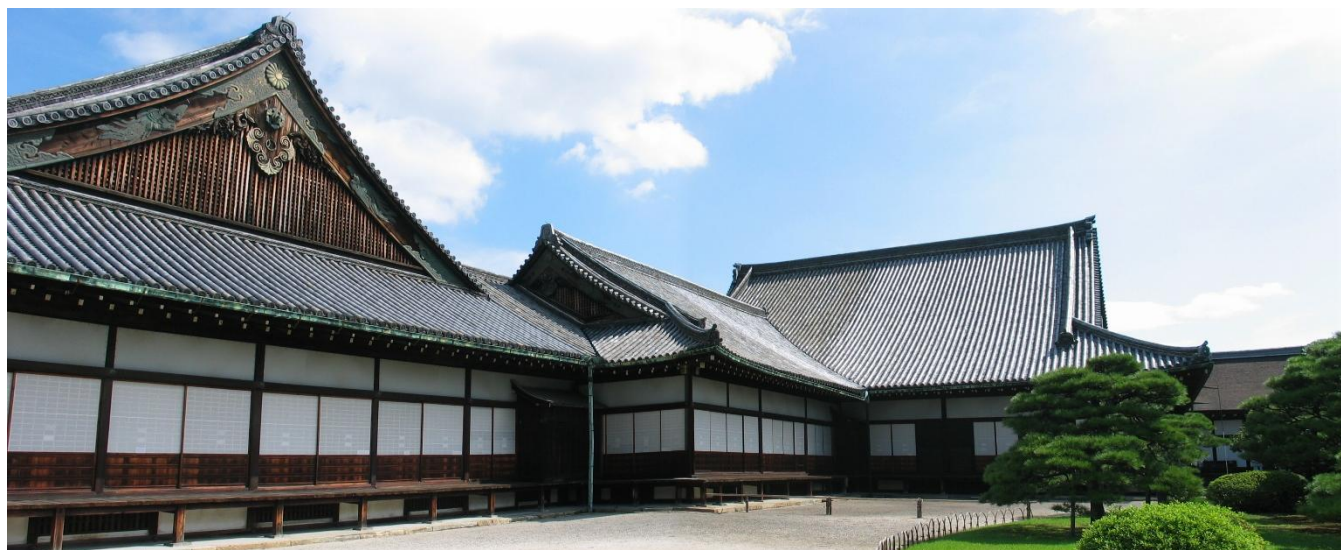
Castelo Nijo – Kyoto, Japão.