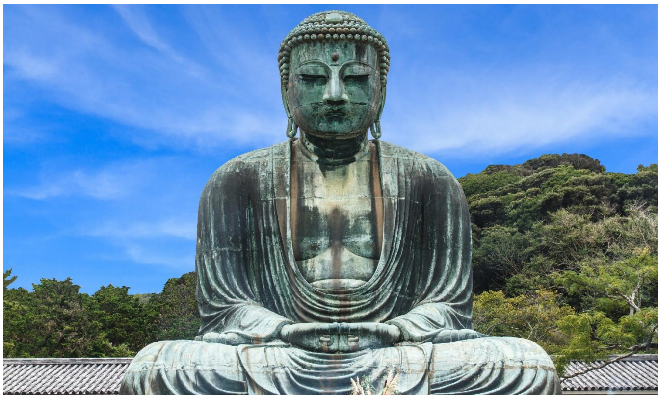
Grande Buda de Kamakura, Japão.

Café da manhã no hotel. Saída para visitas aos principais atrativos da região, começando pelo Santuário Tsuruoka Hachimangu, importante centro espiritual cercado por belos jardins. Continuação para o Grande Buda, um dos ícones históricos mais impressionantes do Japão, seguido de visita ao Templo Hase, conhecido por sua atmosfera serena e belas paisagens. Ao final do passeio, retorno ao hotel. Hospedagem.