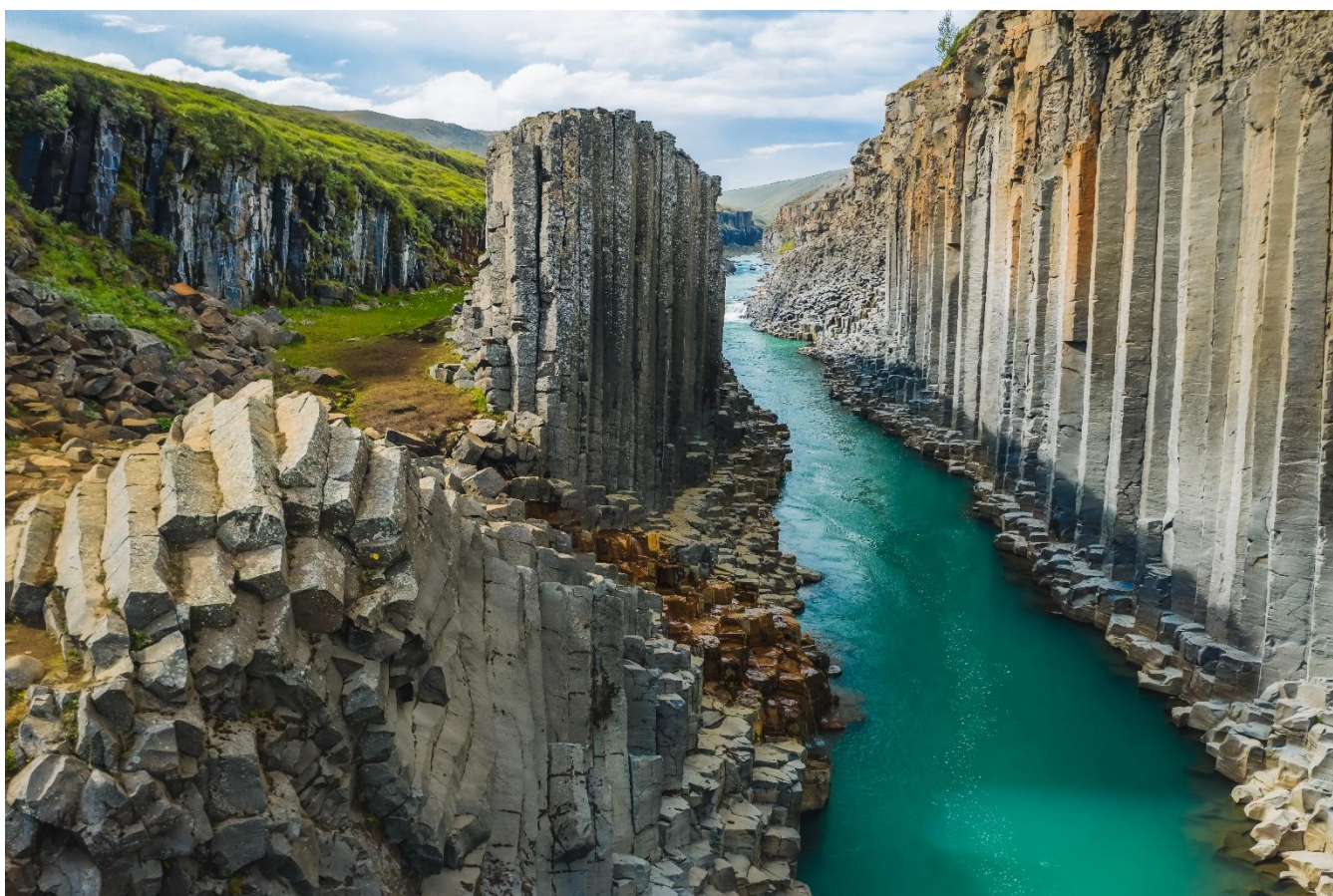
Cânion de Stuðlagil, Islândia

Na sequência, conheceremos o cânion de Stuðlagil, célebre por suas colunas de basalto perfeitamente alinhadas, cortadas por águas de tom azul-glacial, um dos cenários mais fotogênicos da Islândia. À tarde, iniciaremos nossa travessia pelos Fiordes do Leste, região remota, de estradas sinuosas, montanhas abruptas e vilas de pescadores praticamente intocadas pelo tempo. Chegada ao hotel. Jantar incluído e hospedagem.