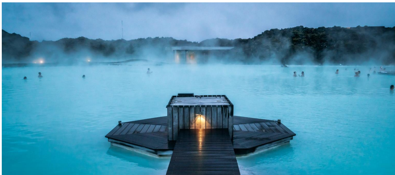
Lagoa Azul, Islândia