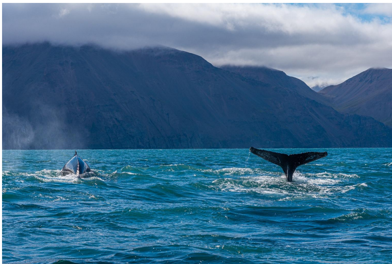
Observação de Baleias, Islândia

Café da manhã no hotel. O dia começa com uma das experiências mais marcantes da viagem: a observação de baleias no norte da Islândia. Embarcaremos na baía de Skjálfandi, uma das áreas mais ricas do país em vida marinha. A bordo de um tradicional barco islandês de carvalho, navegaremos em busca de baleias, golfinhos e aves do Ártico, enquanto especialistas compartilham informações sobre esse delicado ecossistema. Entre o mar e o céu, com chocolate quente e bolinhos de canela servidos a bordo, vivenciaremos um encontro emocionante com a natureza em estado puro.