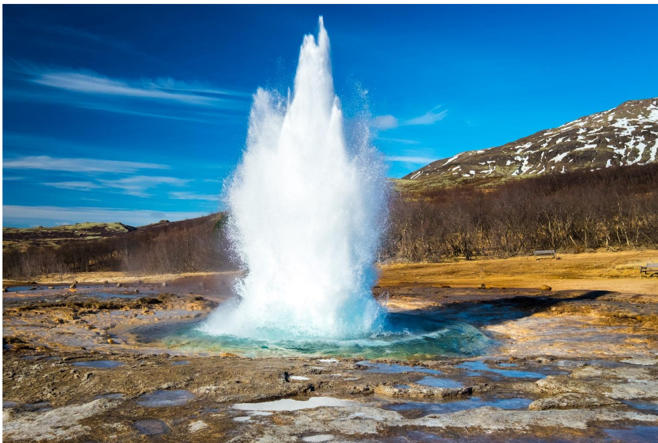
Geysir, Círculo Dourado, Islândia

Café da manhã no hotel. Hoje percorremos o famoso Círculo Dourado, rota que reúne alguns dos locais mais simbólicos do país. Visitaremos a fazenda Friðheimar, onde estufas aquecidas por energia geotérmica produzem tomates durante todo o ano, em um interessante encontro entre sustentabilidade, tecnologia e gastronomia. Seguiremos até Gullfoss, a “cachoeira dourada”, e à área geotermal de Geysir, onde jatos de água fervente irrompem da terra em intervalos regulares.