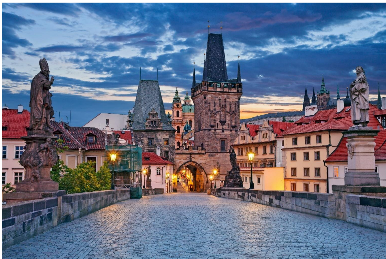
Ponte Carlos, Praga, República Tcheca

Você também verá a Catedral de São Vito, maior edifício religioso do país e uma das mais prestigiosas catedrais góticas da Europa, o antigo Palácio Real e a Igreja do Menino Jesus de Praga. O passeio continua na Cidade Antiga, “Stare Mesto”, cujo distrito tem sua origem a mais de 1.000 anos, e é um dos principais locais históricos da Boêmia. Ao caminhar pelas ruas estreitas da cidade, você descobre a famosa Ponte Carlos, o bairro judeu, a Prefeitura, seu famoso relógio astronômico e a belíssima Igreja de Nossa Senhora de Týn. Hospedagem.