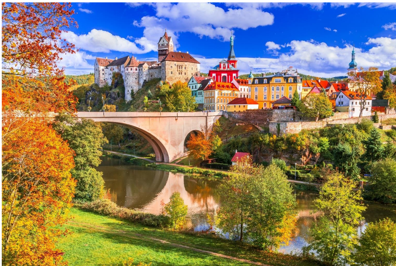
Karlovy Vary, Praga, República Tcheca