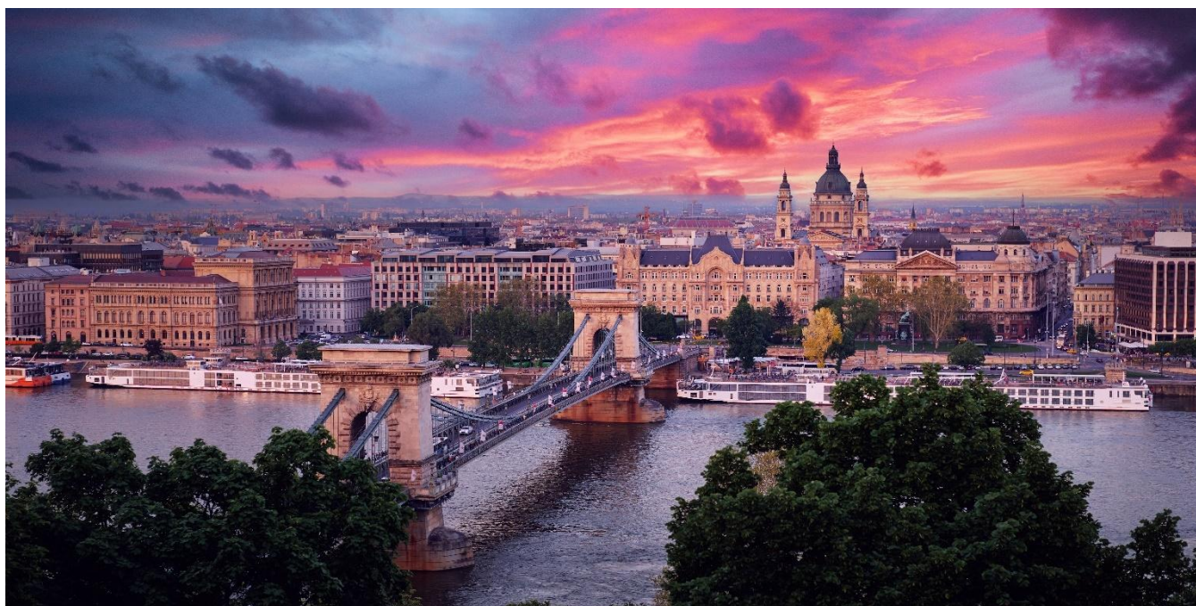
Ponte das Correntes, Budapeste, Hungria