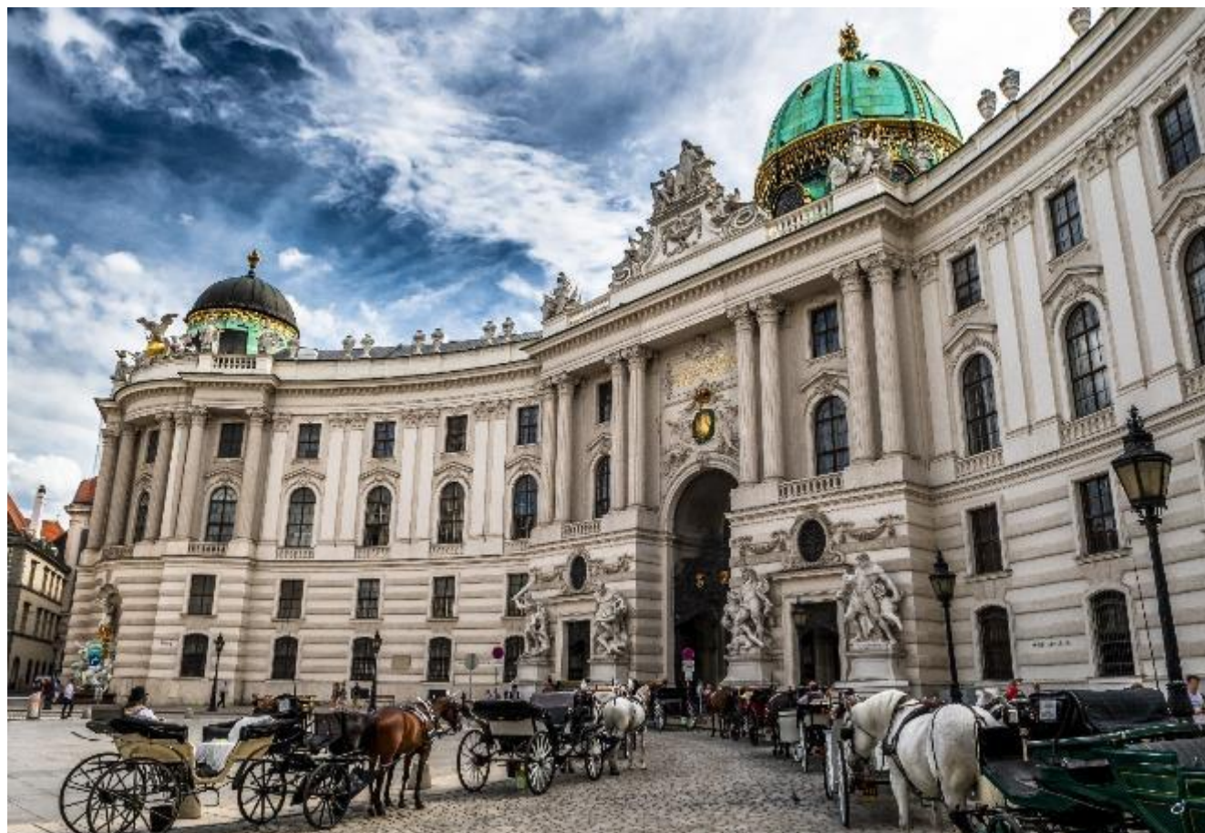
Palácio Hofburg, Viena, Áustria

Após o passeio em ônibus, seguimos a pé pelo centro histórico. No caminho até a icônica Catedral de Santo Estêvão, sentimos de perto a atmosfera vibrante da cidade. Diante da catedral, fazemos uma breve pausa para apreciar sua impressionante arquitetura antes de continuar pela animada Kärntnertorstraße.