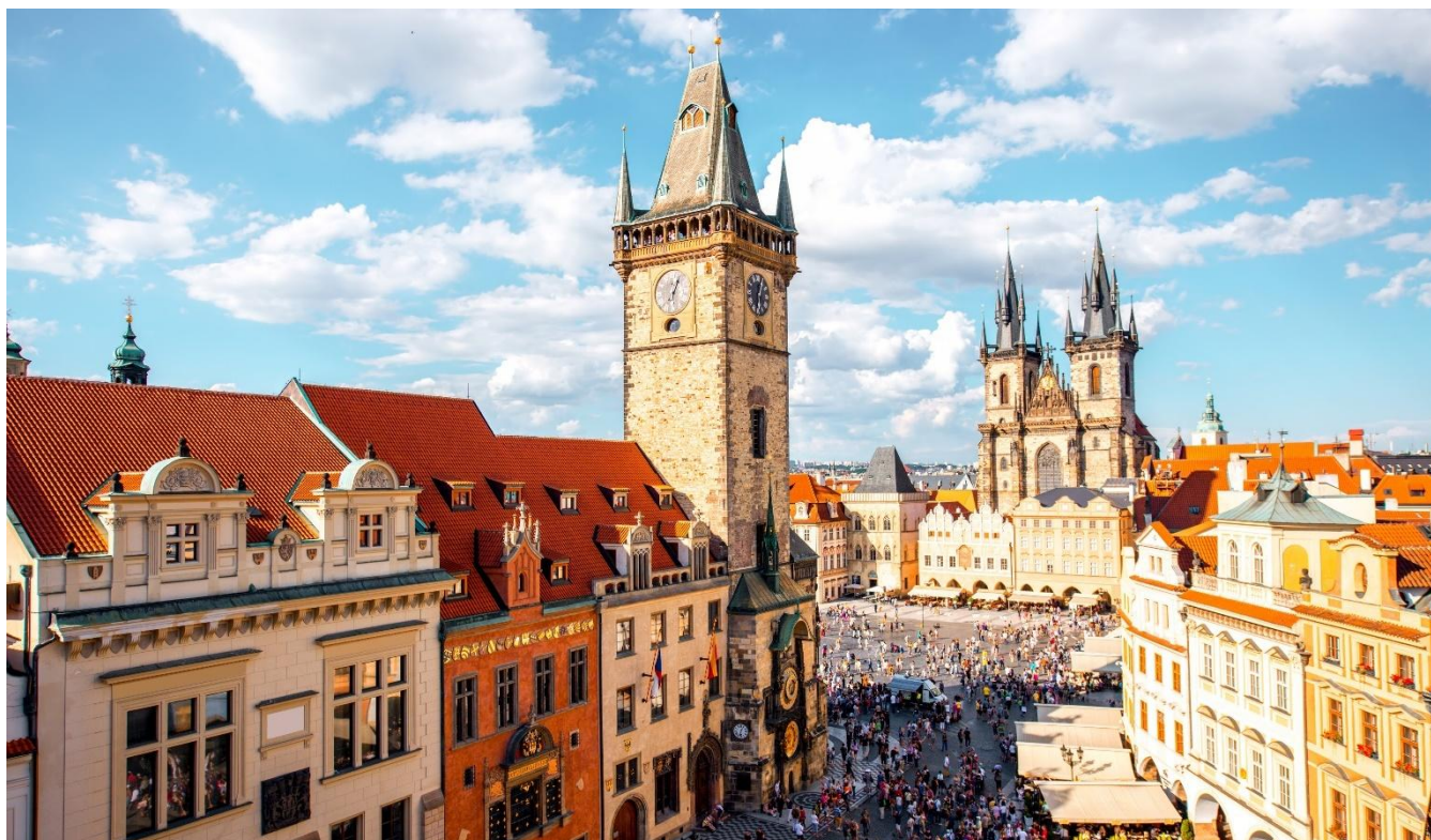
Cidade antiga de Praga, República Tcheca

Café da manhã no hotel. Dia dedicado à visita da cidade antiga de Praga e ao bairro do Castelo. Palácios, igrejas e conventos cercam em harmonia e dominam a capital da República Tcheca.