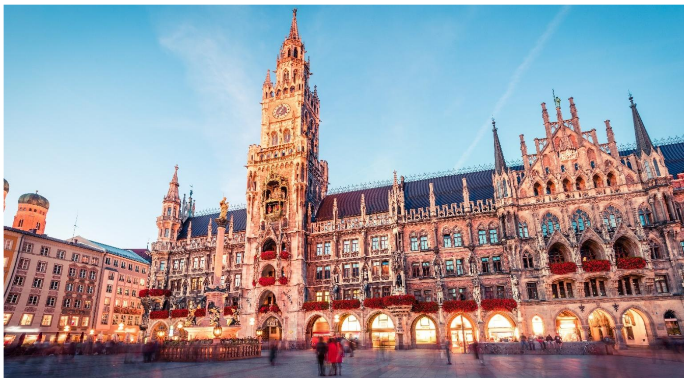
Marienplatz, a praça central de Munique, na Alemanha

Café da manhã no hotel e visita da cidade. Capital da Baviera, Munique é a terceira maior cidade da Alemanha, sendo também a sede de várias empresas como a BMW, a Allianz e a Siemens.