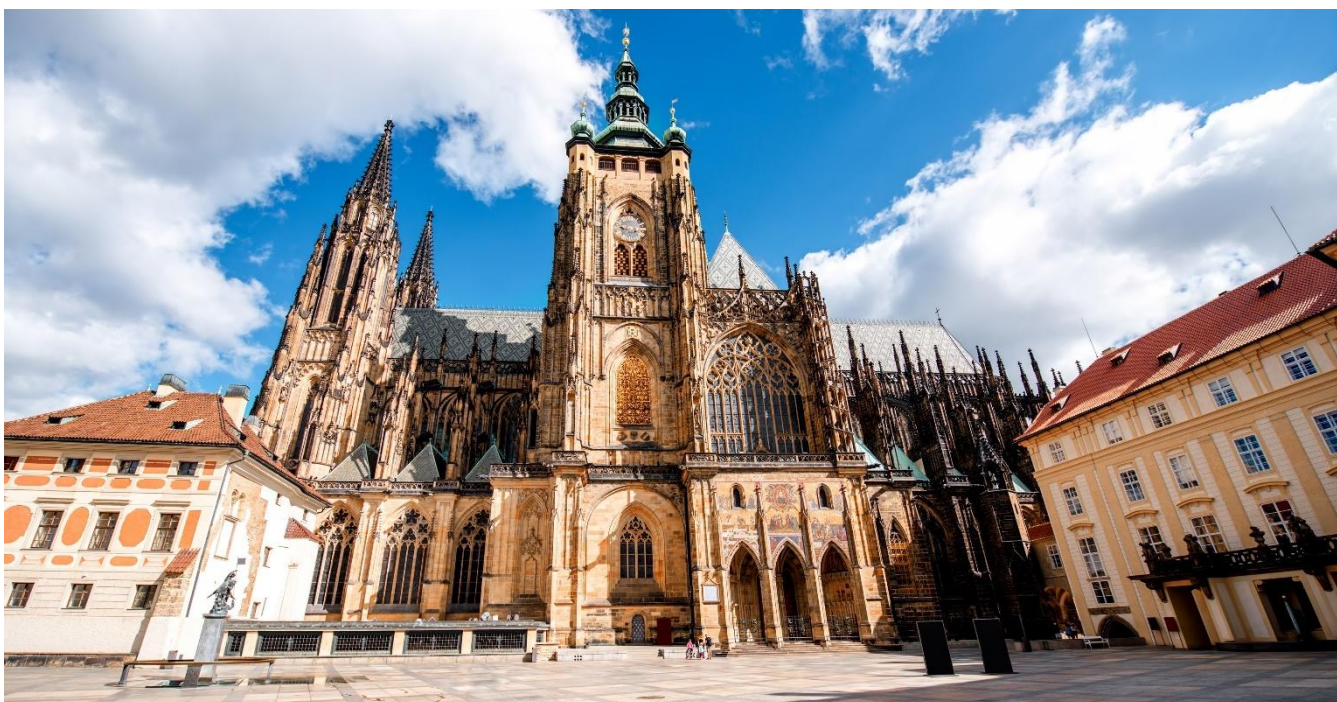
Catedral de São Vito, Cidade antiga de Praga, República Tcheca