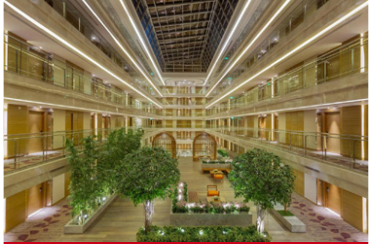
Holiday Inn City Centre