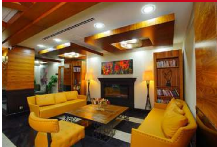
New Park Ankara