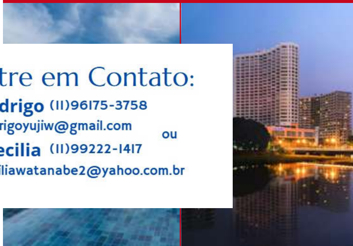
Kantary Hills ou Centara Riverside