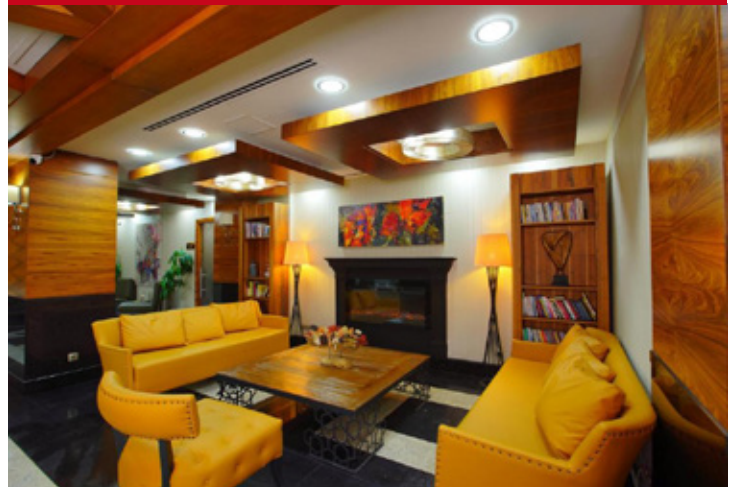
New Park Ankara