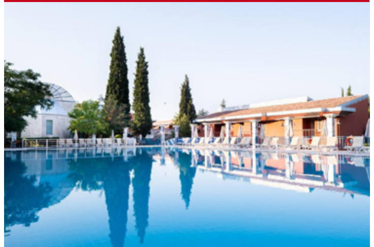
Colossae Thermal & Spa