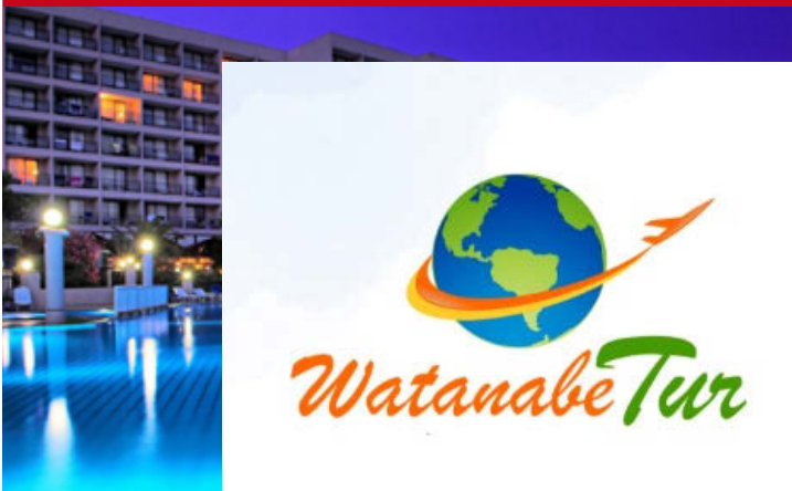
Tuzan Beach Resort