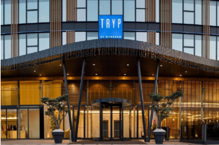
Tryp by Wyndham Beyoğlu