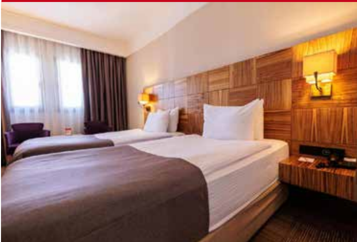
Ramada dy Wyndham Cappadocia