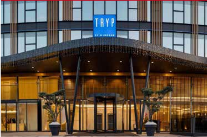
Tryp by Wyndham Beyoğlu