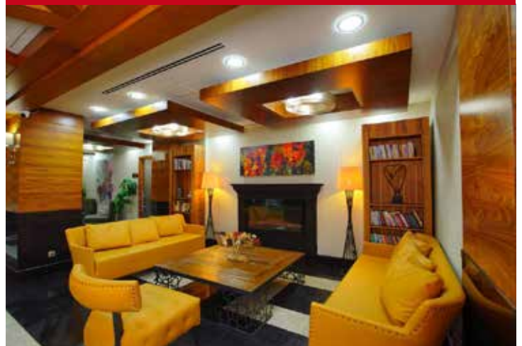
New Park Ankara