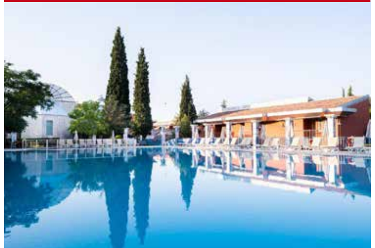
Colossae Thermal & Spa