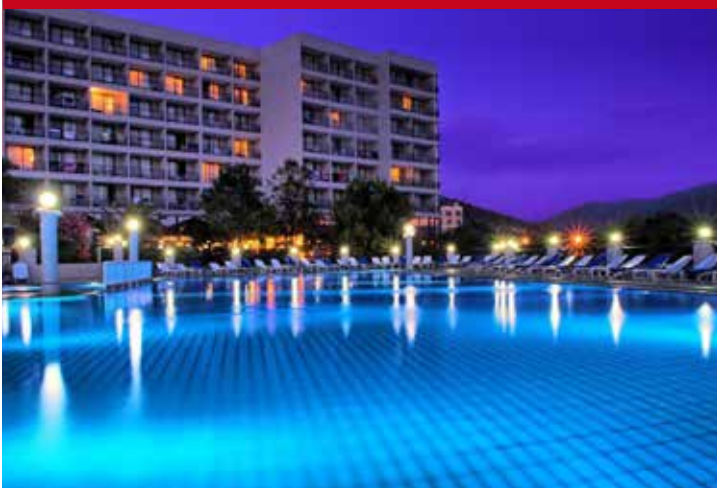
Tusan Beach Resort